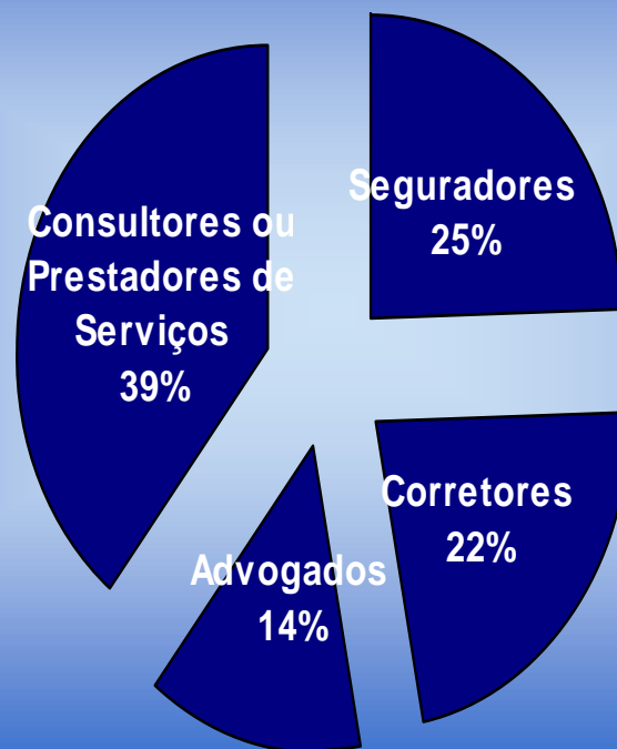
Gráfico 1 - Perfil dos Respondentes